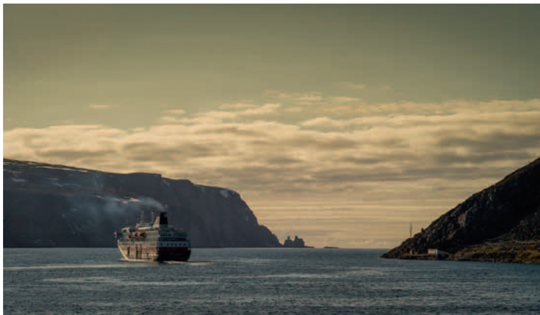
DAGLIGE ANLØP: Hurtigruten har trafikkert kysten av Nord-Norge i mer enn hundre år. Her seiler Kong Harald ut Kjøllefjorden med den karakteristiske Finnkirka som kjent landemerke i det fjerne.